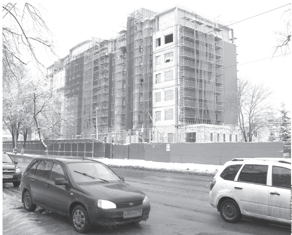
Специалистам достраиваемого перинатального центра облбюджет приобретет 22 квартиры.

Дело в том, что пациенты с орфанными заболеваниями получают в федеральных клиниках рекомендации по лечению крайне дорогостоящими препаратами. Например, одной девочке 2004 года рождения рекомендован препарат стоимостью 600 000 рублей за упаковку на пять дней, то есть только на ее лечение областной бюджет должен потратить 39 миллионов рублей в год. И суды, хотя рецепты носят рекомендательный характер, а ле-