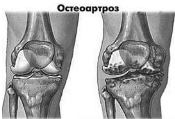
Остеоартроз Здоровый коленный сустав Сустав, пораженный остеоартрозом: видны разрастания костной ткани вокруг эрозированного суставного хряща

При артрозе коленного сустава пойдет на пользу ношение специального ортеза. Он фиксирует сустав в пра-